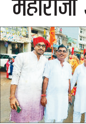
शोभायात्रा में शामिल अग्र समाज के सदस्य।