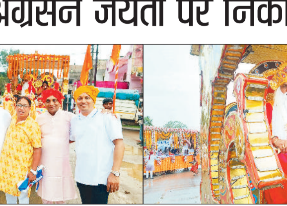
शोभायात्रा में महाराज अग्रसेन की झांकी।

पथलगांव। महाराज अग्रसेन की जयंती के मौके पर शहर में धूमधाम से शोभायात्रा निकाली गई। इस बार भी शोभायात्रा को भव्य स्वरूप में निकाला गया था। जिसमें महाराज अग्रसेन की भव्य झांकियों के साथ