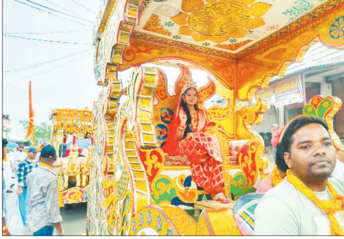
पथलगांव में निकाली गई मां दुर्गा की भव्य शोभायात्रा।

पथलगांव में नवरात्र का पर्व प्रतिवर्ष हर्षोल्लास के साथ मनाया जाता है। नगर में जगह-जगह समितियों द्वारा पूजा पंडालों का निर्माण कराकर मां दुर्गा की आराधना की जाती है। इसके लिए पिछले एक महीने से तैयारियों की जा रही थीं। इस वर्ष भी सात स्थानों पर अलग-अलग समितियों द्वारा पूजा पंडालों का निर्माण कराया गया है जिनमें मां दुर्गा की भव्य प्रतिमाएं स्थापित की गई हैं। सोमवार को नवरात्र के प्रथम