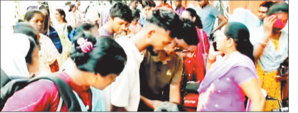
राउरकेला। वित्तीय मामलों के तहत

शहर में एक बड़ा धोखाधड़ी मामला सामने आया है, जिसमें एक फर्जी कंपनी ने बेरोजगार युवाओं को करोड़पति बनाने का झंझा देकर अब तक प्राप्त शिकारियों के अनुरूप 2 करोड़ रुपए से अधिक की ठगी कर ली, भविष्य में इसके राशि में बढ़ोतरी से इन्कार नहीं किया जा सकता।