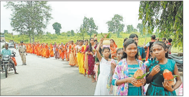
पुलिस बल के साथ निकाली गई शोभायात्रा।