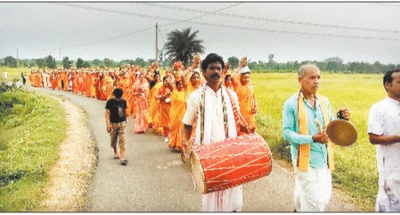
पारंपरिक वाद्ययंत्र के साथ 2100 माताओं ने उदाया कलश।

धर्मनगरी कोतबा में भव्य कलश यात्रा पारंपरिक वाद्ययंत्र मॉदर ढोल की थाप में बाजे गाजे के साथ रामायण की चौपाइयों गाते हुए परंपरागत तरीके से संत समाज द्वारा अगुवाई कर कलश यात्रा निकाली गई। कलश यात्रा में हजारों नारी