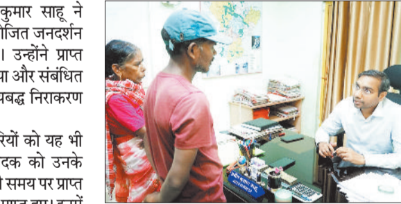
लाभ दिलाने सहित विभिन्न मामलों से संबंधित आवेदन शामिल थे।